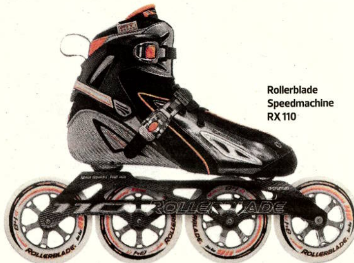
Rollerblade Speedmachine RX110