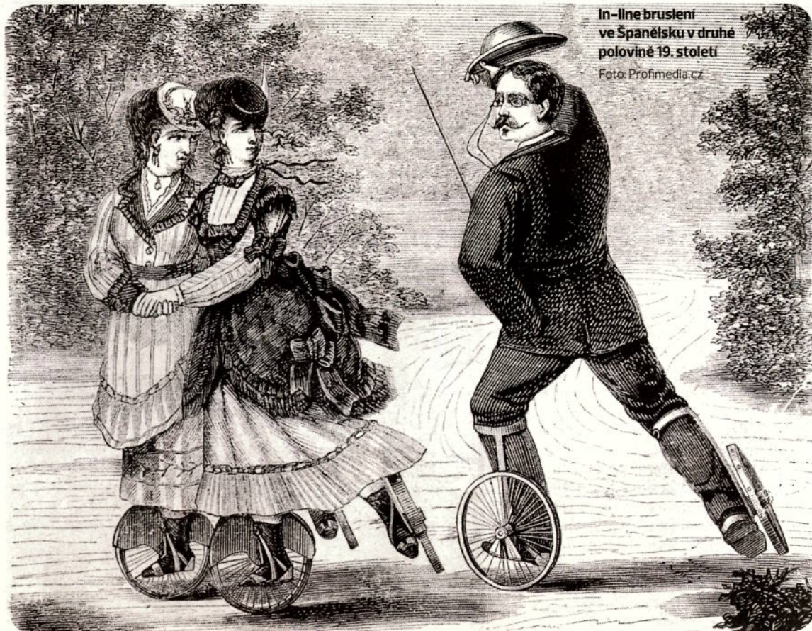
In-line bruslení ve Španělsku v druhé polovině 19. století